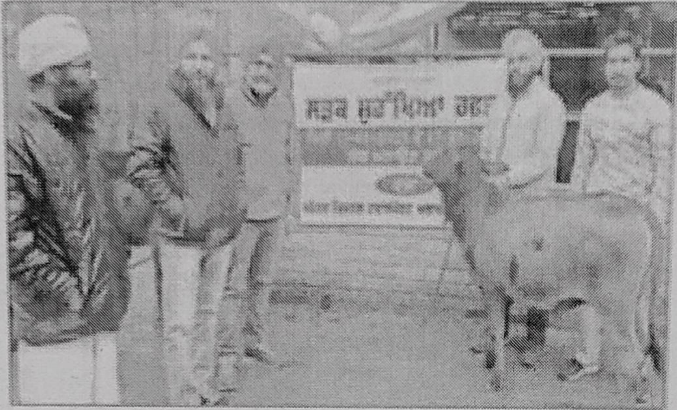
बेसहारा पशु को गौशाला पहुंचाते अधिकारी।

इसके चलते पहले दिन स्कूलों में बच्चों को सीमिनार लगाकर ट्रैफिक नियमों संबंधी जानकारी दी गई जबकि दूसरे दिन लोगों को सड़कों पर